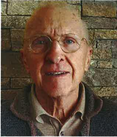
Dr. Ljubo Mario Präsident

Es ist für mich eine besondere Freude, dass die Slowenische Golf-Senioren-Gesellschaft in diesem Jahr die XIX. K&K Monarchie Trophy veranstalten darf. Das 6-Nationenturnier der ehemaligen Monarchieländer wird auf dem Golfplatz Livada in Moravske Toplice (Terme 3000) nahe der österreichischen, ungarischen und kroatischen Grenze ausgetragen.