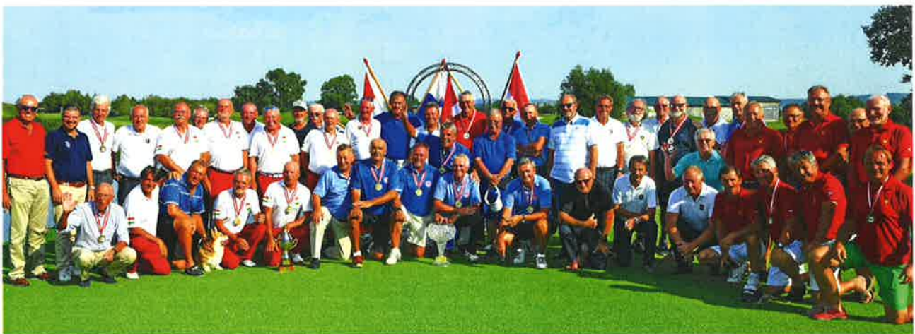
Monarchie Trophy 2017